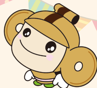
本庄市マスコット はにぽん

開催日時 毎月第4月曜日 午後1時30分～3時30分 会場 はにぽんプラザ2階 活動室D・E